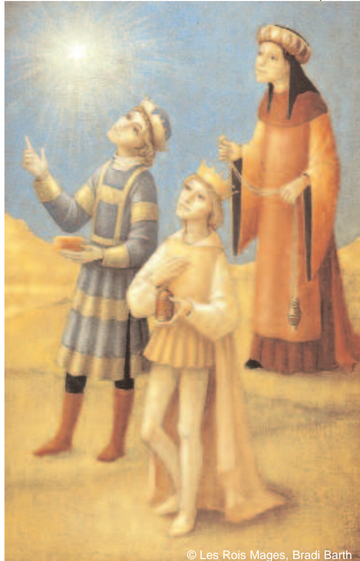
© Les Rois Mages, Bradi Barth

L'humiliation sacramentelle de Jésus-Christ, voilà la seconde épreuve de la foi chrétienne. Jésus, dans son Sacrement, ne voit, le plus souvent, que l'indifférence des siens, leur incrédulité et leur mépris. Triste vérité : « Le monde ne l'a pas reconnu. » (Jn 1, 10) Mais pourtant, voici la cause de notre allégresse : « A tous ceux qui l'ont accueilli, il a donné pouvoir de devenir enfants de Dieu, à ceux qui croient en son nom. » (Jn 1, 12)