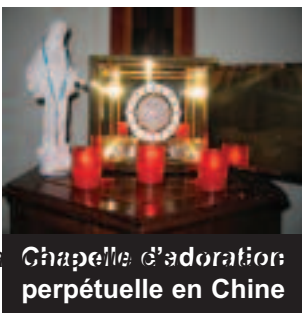
ra Chapelle d'adoration perpétuelle en Chine

L'image d'Abraham prêt à sacrifier son fils Isaac reflète le don de l'amour du Père. Car l'Eucharistie provient du sacrifice que le Père fait de son Fils unique. L'Eucharistie est 'la gloire qu'il tient de son Père comme Fils unique plein de grâce et de vérité.' (Jn 1, 14)