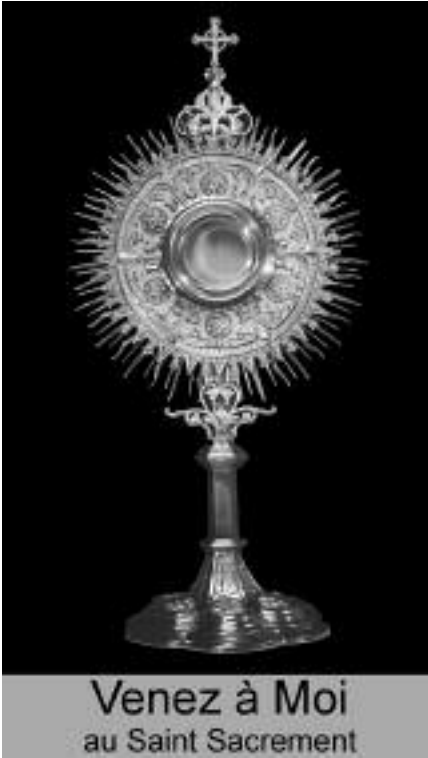
Venez à Moi au Saint Sacrement